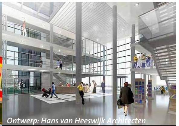
Ontwerp: Hans van Heeswijk Architecten